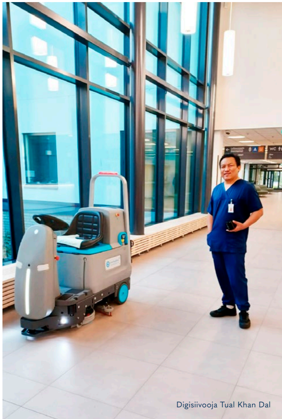
Digisiivooja Tual Khan Dal

Lisäksi robotin kerryttämä data on tuonut apua työn suunnitteluun. Samalla Päijät-Hämeen Laitoshuoltopalvelut on viestinyt puhtausalalla olevista uudeltaisista uramahdollisuuksista ja tehnyt alaa mielenkiintoiseksi tuleville puhtausalan ammattilaisille.